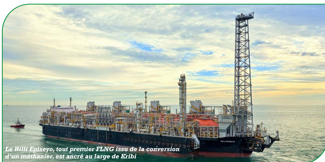
Le Hilli Episeyo, tout premier FLNG issu de la conversion d'un méthanier, est ancré au large de Kribi

Un second projet est en cours, en vue de la mise en valeur du champ gazier transfrontalier Yoyo/Yolanda, en partenariat avec le groupe Chevron et le gouvernement equato-guinéen.