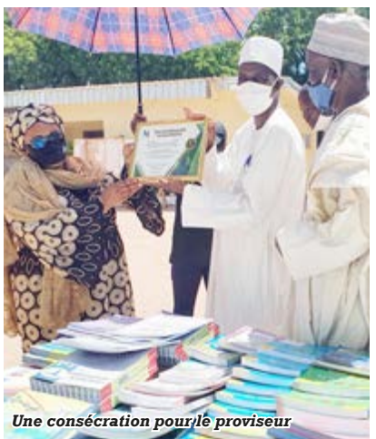
Une consécration pour le proviseur

Le 29 octobre, c'est aux aurores que l'équipe de la SNH quitte Ngaoundéré pour Garoua. 279 km plus loin, l'attendent impatiem-