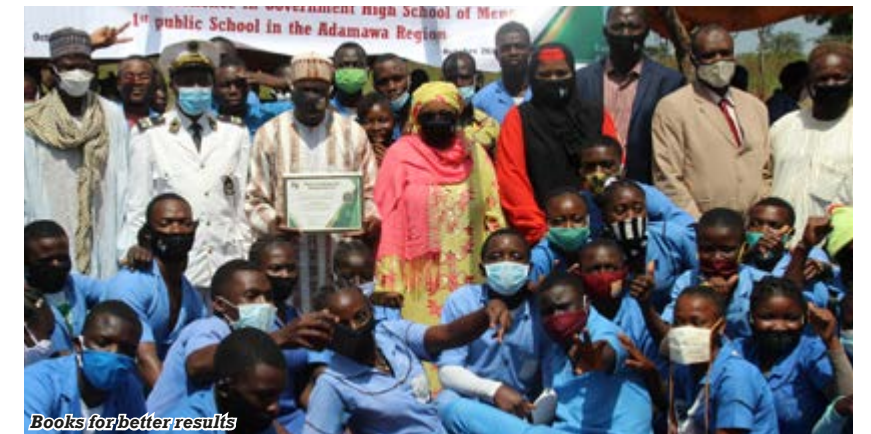
Books for better results

After a well-deserved night's rest, the delegation continued its journey by road. Roads in the region have been badly damaged by rain. The direct route to Tibati is impassable, explains the driver. We therefore have to take a longer route, which was also a difficult one, particularly because of the ongoing construction works. The landscape is made up of fields and trees. The plants show by their yellowish foliage that the rainy