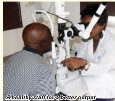
A healthy staff for a better output

On the occasion of World AIDS Day, celebrated on December 1 st , workers were invited to be tested at the head office infirmary and by company doctors at the various SNH sites.