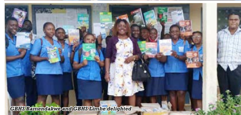
GBHS Bamendakwe and GBHS Limbe delighted