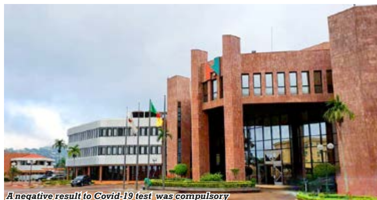
A negative result to Covid-19 test was compulsory