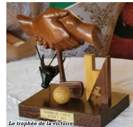
Le trophée de la victoire