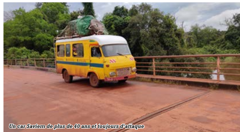
Un car Saviem de plus de 40 ans et toujours d'attaque