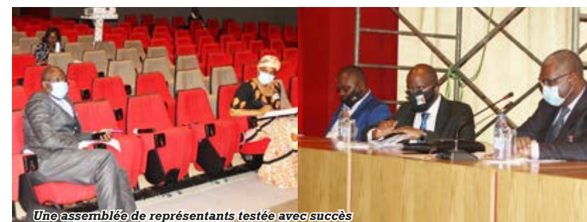
Une assemblée de représentants testée avec succès