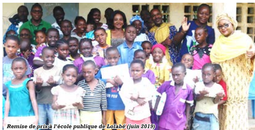
Remise de prix à l'école publique de Lolabé (juin 2019)

nous offrons des livres variés pour une bibliothèque scolaire classique. Nous nous sommes rendus compte qu'ils n'étaient pas les plus utiles, le livre scolaire n'étant pas la chose du monde la mieux partagée dans les milieux défavorisés. Nous ne pouvions continuer à privilégier le surrogatoire alors que la cible était demandeuse de l'essentiel vital en matière de formation.