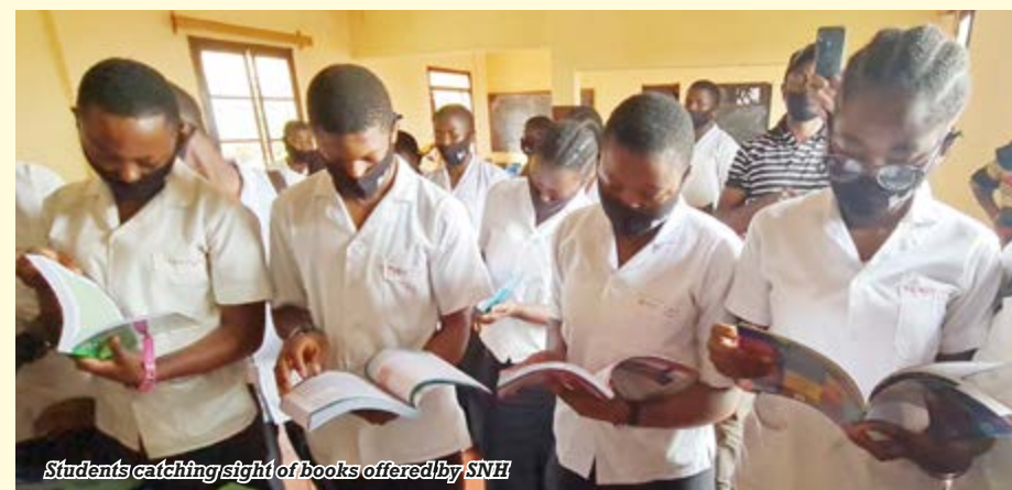
Students catching sight of books offered by SNH

2.30 pm: SNH delegation leaves the premises of the company for the West region. The aim is to reach the town of Bafoussam before the night. At that time of the day; it is not that easy to meet such a challenge, due to traffic