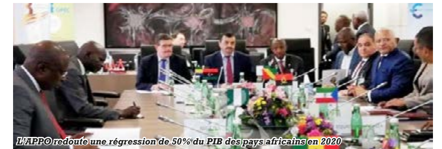
L'APPO redoute une régression de 50% du PIB des pays africains en 2020.

Enfin, l'APPO redoute à long terme, le revers de l'Accord de Paris sur le changement climatique (COP-