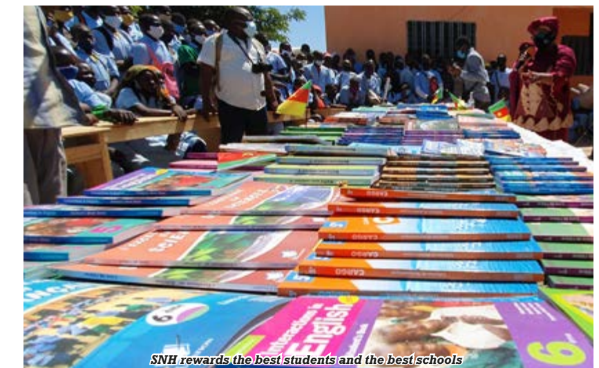
SNH rewards the best students and the best schools