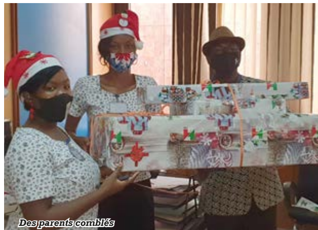
Des parents comblés

La distribution a eu lieu le 23 décembre.