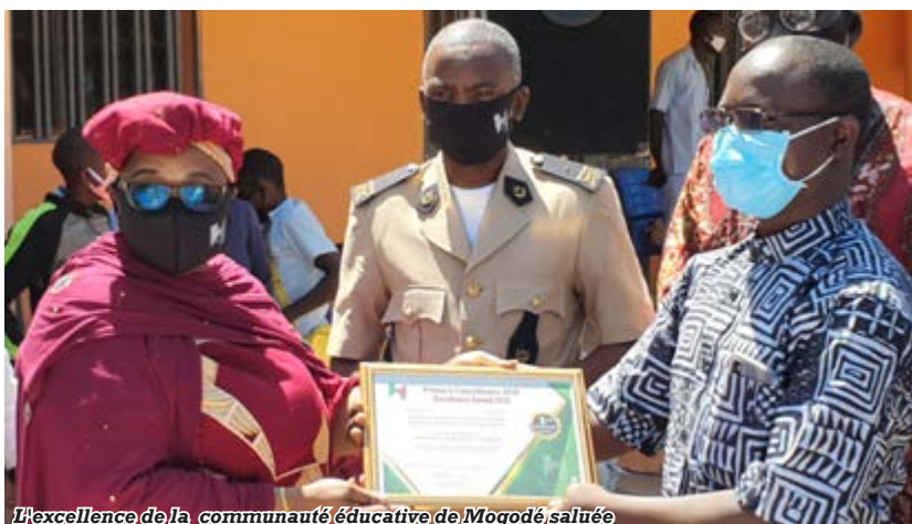
L'excellence de la communauté éducative de Mogodé, saluée

Trois heures pour parcourir 116 km. Cela peut sembler paradoxal face à la mention 60km/h inscrite sur les véhicules de transport. Mais c'est bien le temps qu'il faudra à la délégation de la SNH, partie de Maroua aux premières heures du vendredi 30 octobre, pour rejoindre l'arrondissement de Mogodé, frontalier du Nigeria, qui abrite notamment, le célèbre mont Rhumsiki.