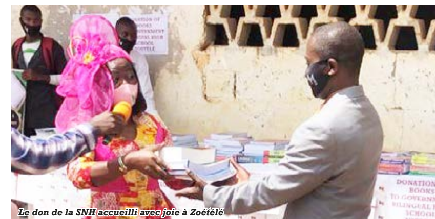
Le don de la SNH accueilli avec joie à Zoétélé