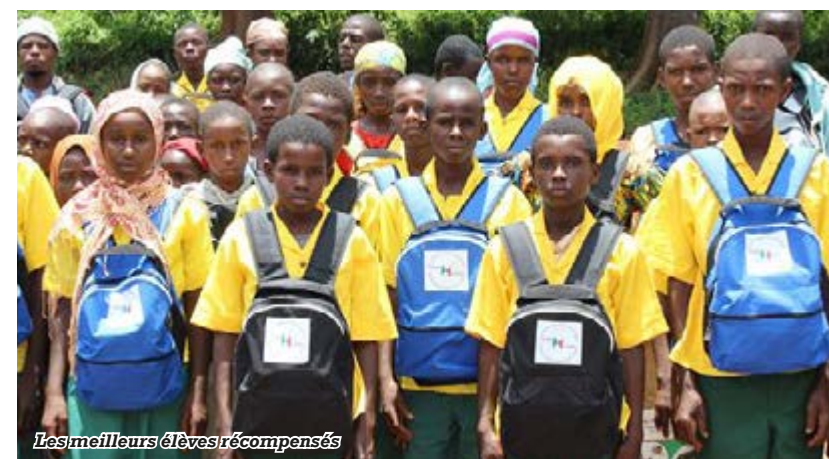
Les meilleurs élèves récompensés