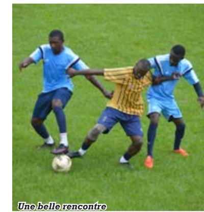
Une belle rencontre