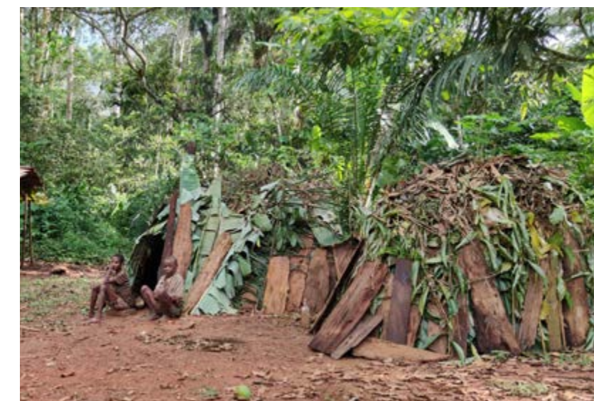
Les pygmées sortent peu à peu de la forêt