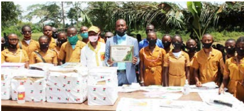
Un don inestimable

Il a fallu deux jours de route pour parcourir les 850 km qui séparent Yaoundé de Moloundou, petite bourgade située à la frontière Cameroun-Congo.