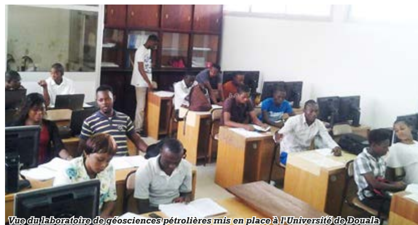
Vue du laboratoire de géosciences pétrolières mis en place à l'Université de Douala

Mais je dois vous avouer que ce sont ces expériences là que je préfère,