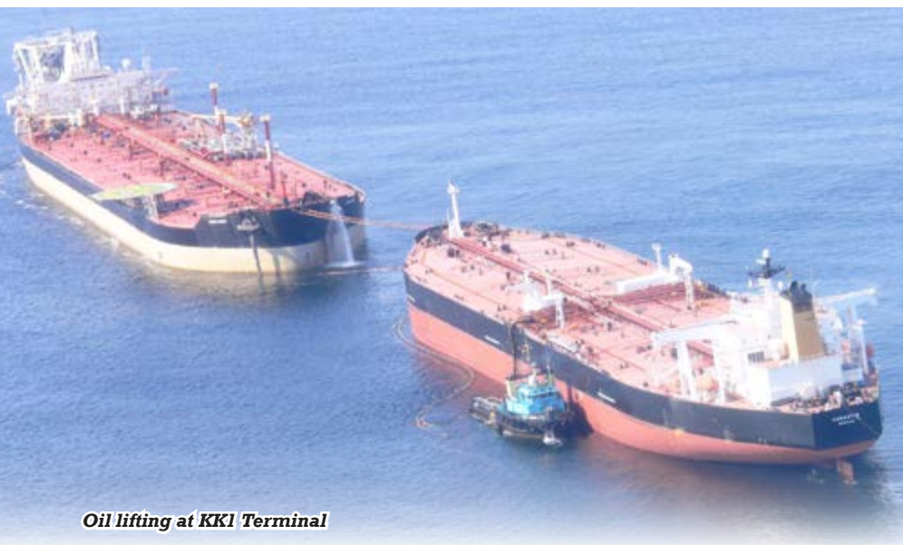
Oil lifting at KKI Terminal

The Pipeline Steering and Monitoring Committee (PSMC) reviewed from 17 th to 24 th November, the activities carried out from 1 st January to 31 st October.