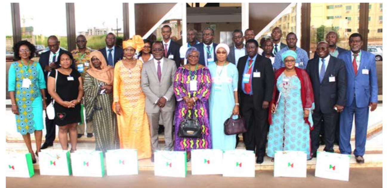
Les sociétés pétrolières et minières ainsi que la société civile étaient représentées