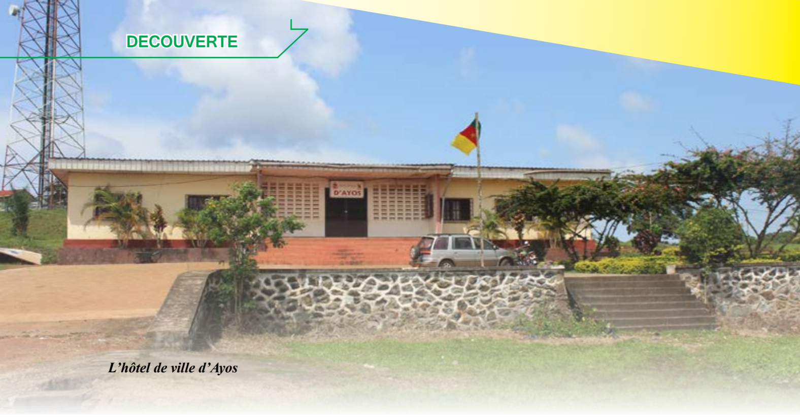
L'hôtel de ville d'Ayos