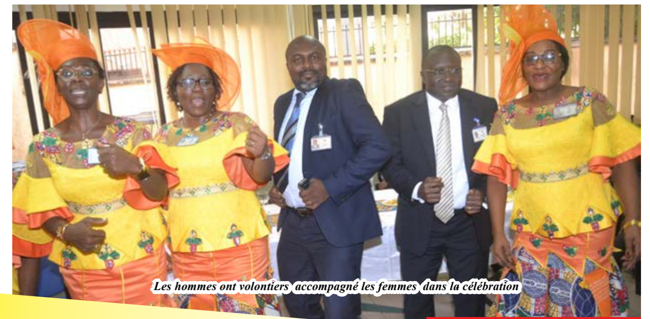
Les hommes ont volontiers accompagné les femmes dans la célébration