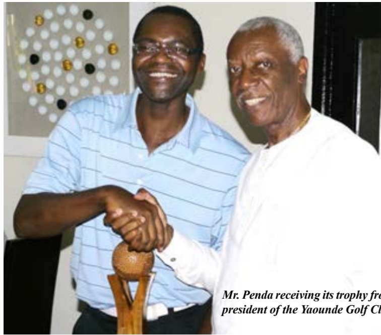
Mr. Penda receiving its trophy from the president of the Yaounde Golf Club

It took place on 25 th November 2017 at the Yaounde Golf Club. The day began with the launch of the 10 th and final day of the SNH Race 2017. Participants gathered around seven a. m. at the Yaounde Golf Club (GCY). Divided in several groups, they took part in