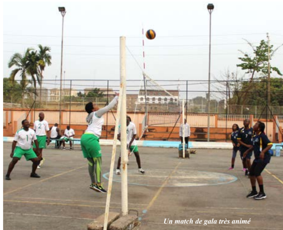
Un match de gala très animé

Hydrocarbons Sports and Cultural Association (ASCH): Membership has increased by 6.25%, to 561. This was notably highlighted in the 2017 balance sheet presented at an Ordinary General Meeting of the association, held on 15 December 2017 at the SNH head office. Moreover, several activities were organized during the first ten months of the year under review, including a field trip to the South region and a picnic for members' children.