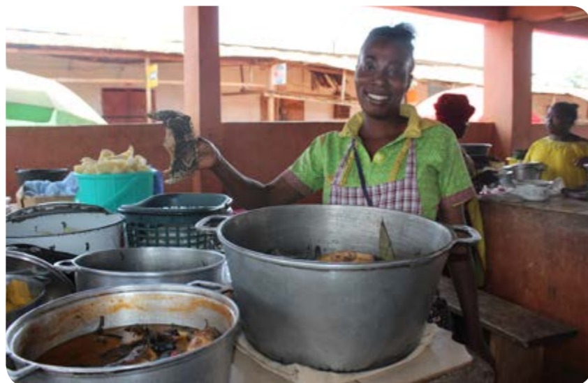
« Présentation » du menu au restaurant du marché