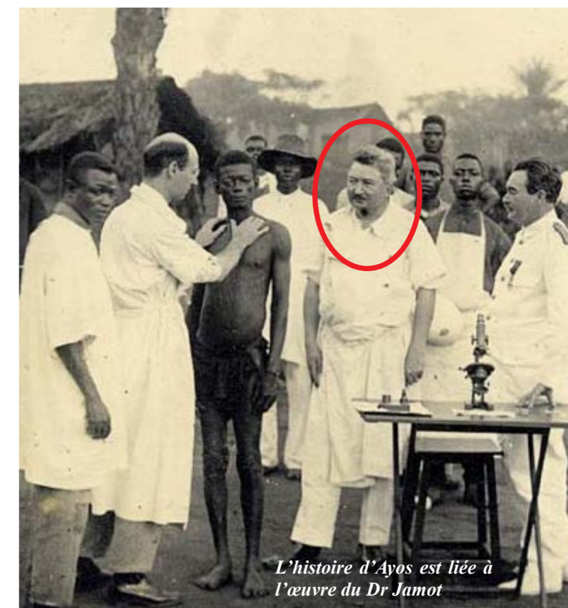
L'histoire d'Ayos est liée à l'œuvre du Dr Jamot