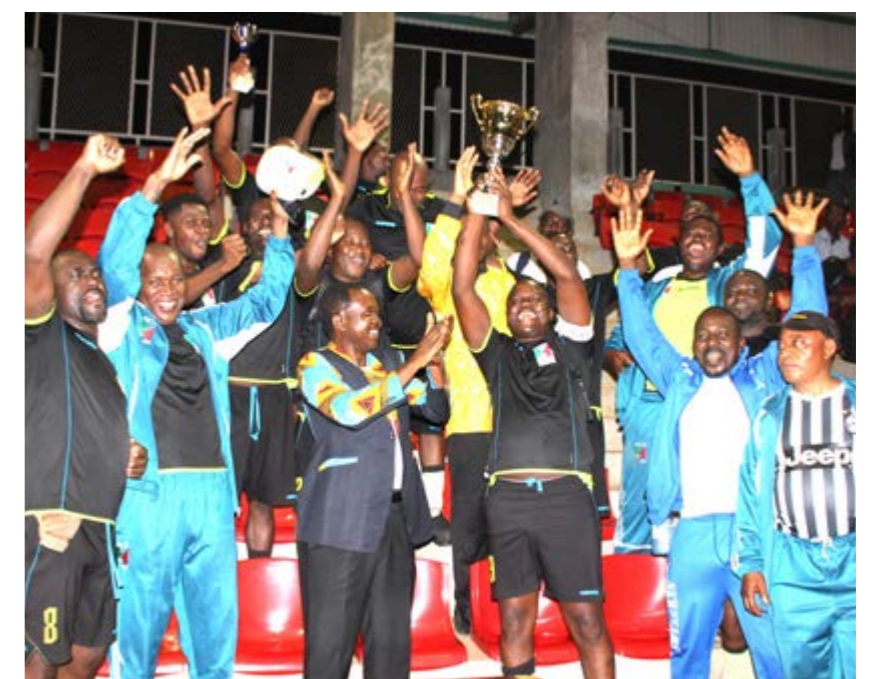
La liesse des joueurs d'Ebomè à l'issue de la victoire

Lors des 45 premières minutes, des contre-attaques en faveur de Gas Energy donnent des frissons au gardien d'Ebomè qui déploie des parades spectaculaires pour le plaisir des spectateurs. A dix minutes de la fin de cette première manche, Ebomè fait une belle remontée qui