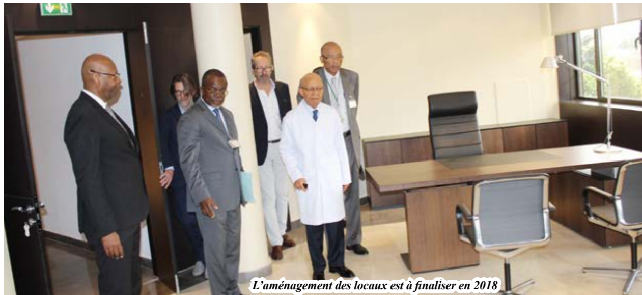
L'aménagement des locaux est à finaliser en 2018

L'ADG a visité le bâtiment le 8 novembre, en compagnie de représentants du maître d'œuvre et de divers contractants.