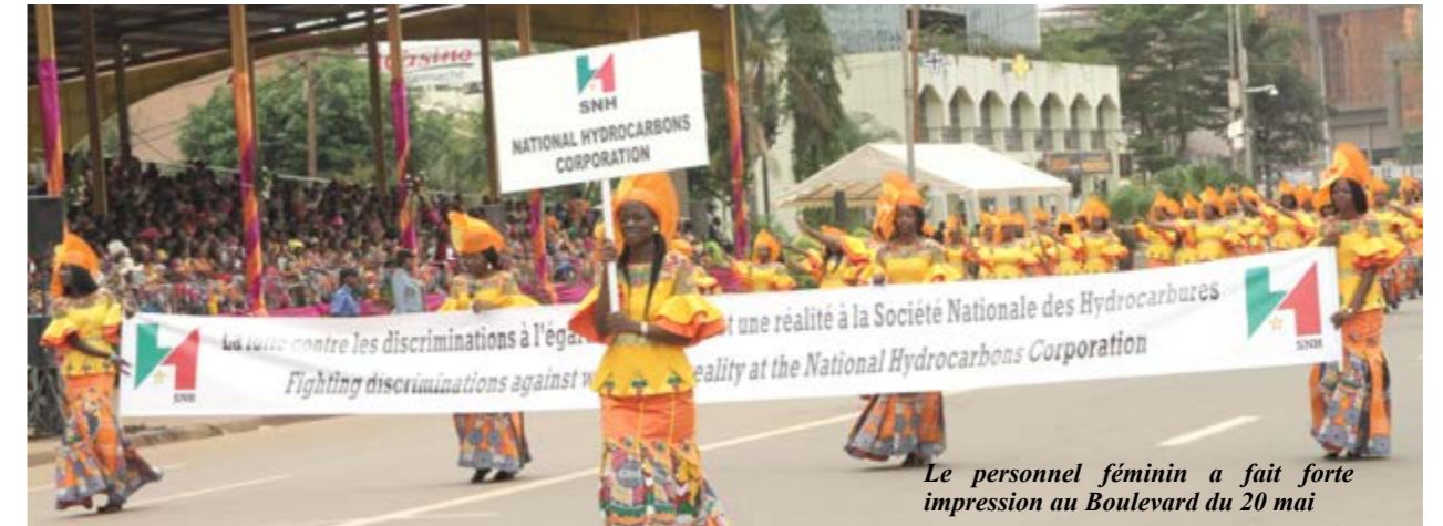
Le personnel féminin a fait forte impression au Boulevard du 20 mai

Le personnel de la SNH s'est joint à celui de la communauté nationale pour célébrer la 33 ème édition de la Journée Internationale de la Femme le 8 mars, sous le thème « Intensifier la lutte contre les discriminations à l'égard des femmes, renforcer le partenariat pour accélérer le développement durable ».