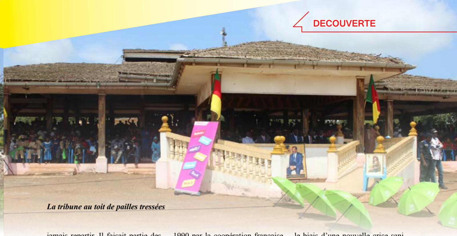
La tribune au toit de pailles tressées

jamais repartir. Il faisait partie des « Jamotins », ces infirmiers formés par le Dr Jamot, dont les descendants continuent, à travers photos et souvenirs, de faire vivre aujourd'hui encore le passé médical de la ville.