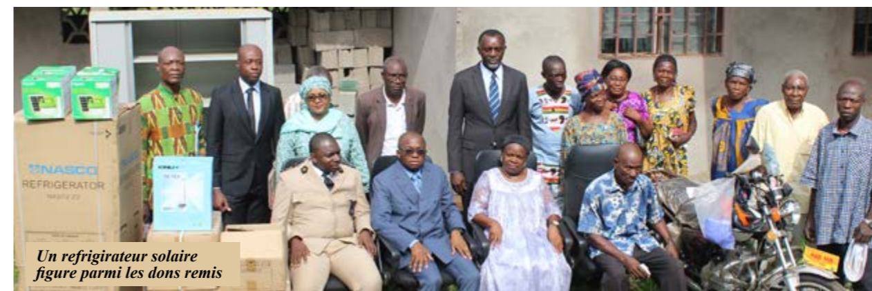
Un réfrigérateur solaire figure parmi les dons remis

La SNH a réfectionné des salles de l'école publique de Yawanda et du centre de santé d'Abée-Yassoukou, qui a également reçu du matériel roulant, médical et de bureau. Les dons ont été rétrocédés le 20 février, au cours de deux cérémonies tenues l'une à la suite de l'autre, sous la présidence du Préfet de la Sanaga Maritime.