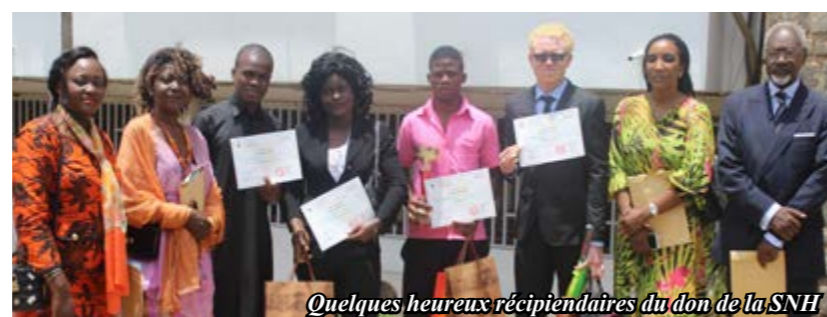
Quelques heureux récipiendaires du don de la SNH

Les ouvrages étaient essentiellement des œuvres littéraires de