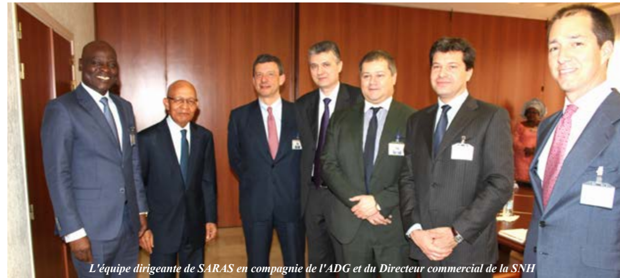
L'équipe dirigeante de SARAS en compagnie de l'ADG et du Directeur commercial de la SNH