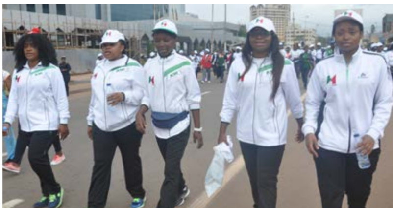
Les agents de la SNH ont bravé la fraîcheur matinale dans la bonne humeur

32 agents féminins de la SNH ont pris part à ce rassemblement organisé par le MINPROFF le 3 mars à Yaoundé, dans le cadre de la célébration de la JIF.