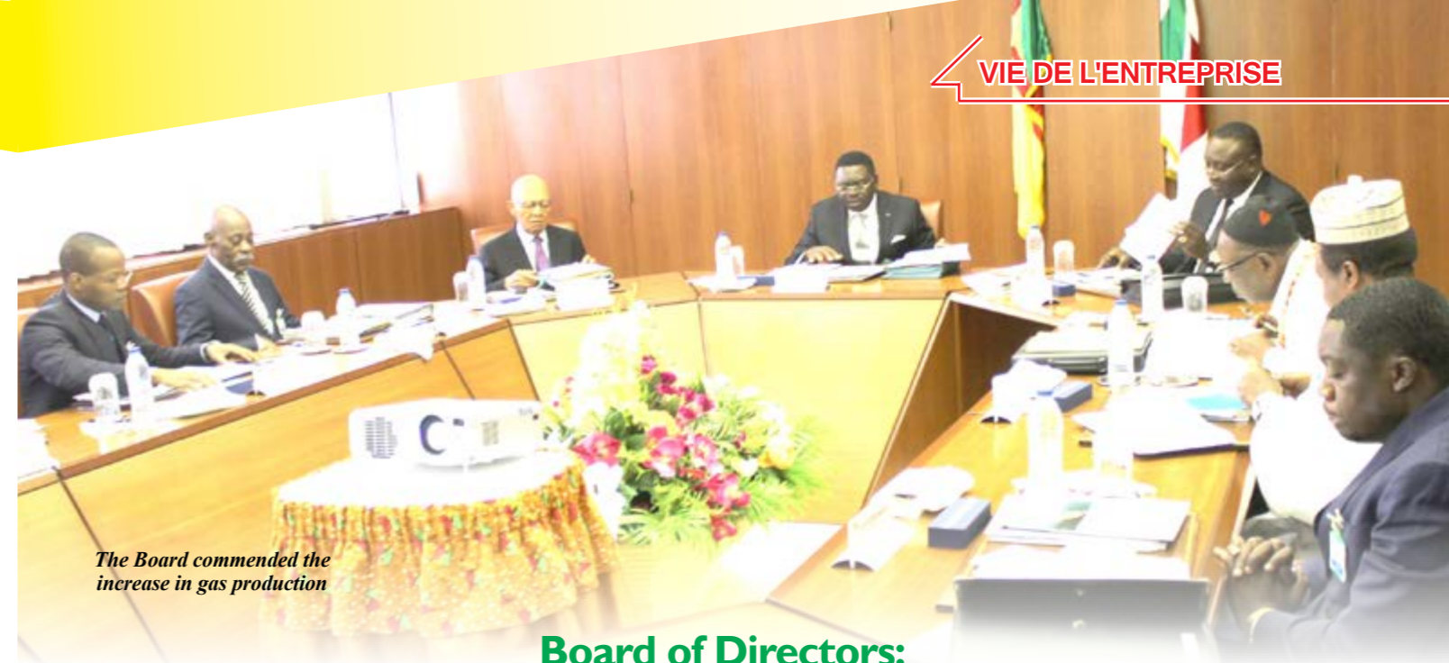
The Board commended the increase in gas production