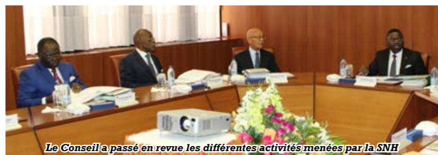
Le Conseil a passé en revue les différentes activités menées par la SNH

Le chargement de la toute première cargaison de gaz naturel liquéfié (GNL) destinée à l'exportation, effectuée en deux lots, a eu lieu les 1 er et 17 mai. Parallèlement, l'approvisionnement du marché local en gaz de pétrole liquéfié (GPL, ou gaz domestique) a démarré le 09 avril.