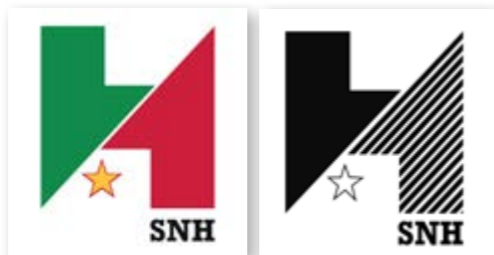
Versions couleur et noir/blanc du logotype de la SNH