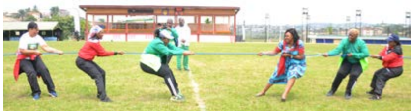
Le tire à la corde a rassemblé les participants, toutes organisations confondues

Les compétitions, lancées par un match de football, se sont déroulées dans la convivialité. À l'issue des épreuves