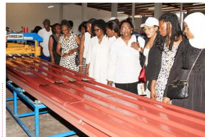
Découverte du processus de façonnage des tôles

Les agents féminins ont pris part, le 23 mai, à des excursions à Yaoundé et à Douala, dans le cadre de la désormais traditionnelle sortie baptisée « Entre nous les mères », regroupant les agents féminins de la société, deux jours avant la célébration officielle de la fête.