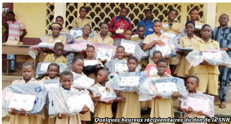
Quelques heureux récipiendaires du don de la SNH

Le représentant du Chef du village et le directeur de l'École publique de Dehane ont exprimé leur profonde gratitude pour les efforts consentis par la SNH afin d'investir dans l'avenir du Cameroun, à savoir la jeunesse. Le Directeur de l'école a indiqué n'avoir jamais vu une telle cérémonie après six ans de service. Selon lui, elle va stimuler les enfants et les pousser à don-