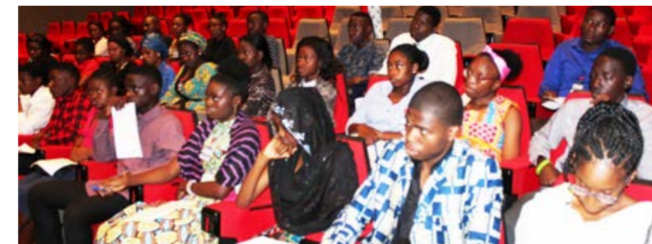
120 students underwent internship