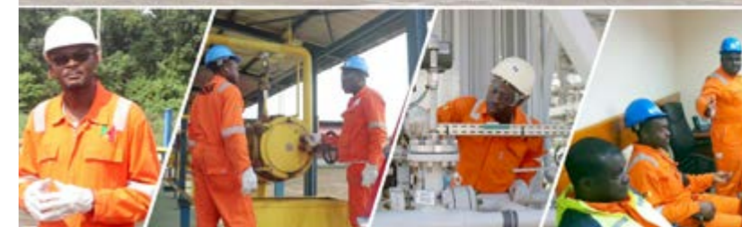
L'équipe d'exploitation du gazoduc travaille en toute sécurité