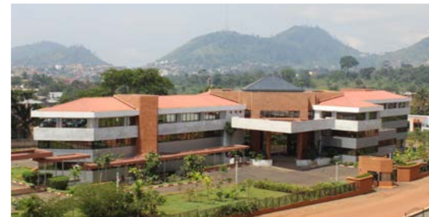
Le nouveau bâtiment compte 110 bureaux

L'occupation progressive des bureaux a débuté au mois de juillet.