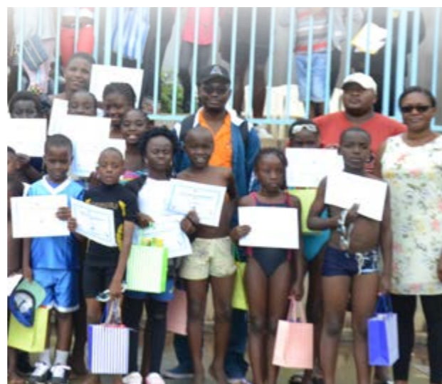
Les efforts ont été récompensés par des prix et des attestations

DECRET N° 2 0 1 8/6 0 2 6/PM DU 17 JUILLET 2018 portant création, organisation et fonctionnement du Comité de suivi de la mise en œuvre de l'Initiative pour la Transparence dans les Industries Extractives.-