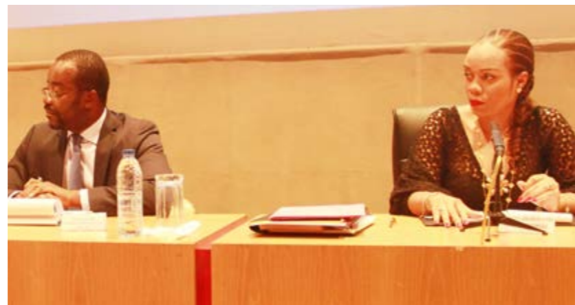
The well-being of the personnel, a major concern for SNH's General Management