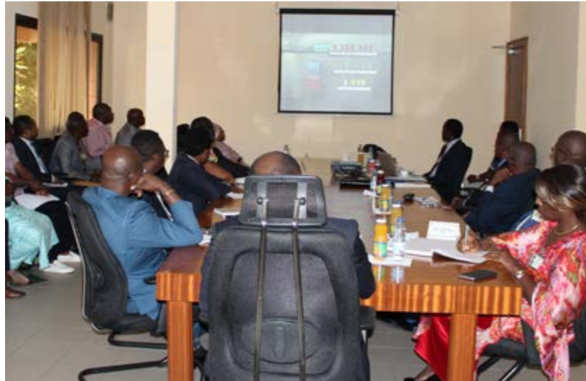
La vidéo a suscité un grand intérêt

Deux sessions d'information se sont tenues à cet effet au siège et à la Représentation SNH de Douala, les 19 et 22 juin.