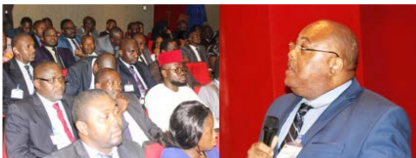
Les actions de la DAG visent à optimiser la sécurité des agents et des biens de la SNH