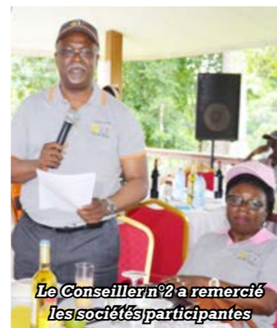
Le Conseiller n°2 a remercié les sociétés participantes

Le dimanche 21 octobre était réservé aux individualités. 41 joueurs y ont pris part, répartis en deux séries mixtes : une 1 ère série mixte constituée de 22 golfeurs ayant un handicap (HCP) compris entre 1 et 24, et une 2 e série mixte constituée de 18 golfeurs dont les HCP sont compris entre 25 et 53. 15 personnes ont été primées à la fin de cette compétition dont 05 par série. 5 prix spéciaux ont été offerts par l'ADG.