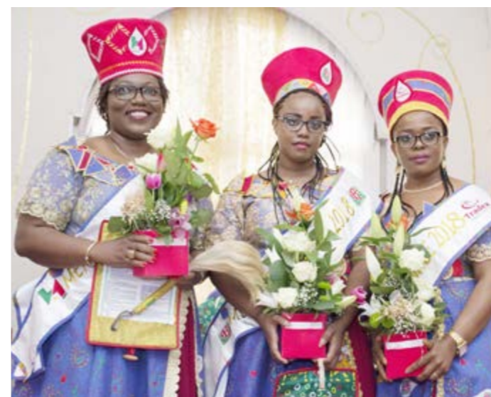
Les mamans R-SNH, Hydrac et Tradex intronisées à Douala