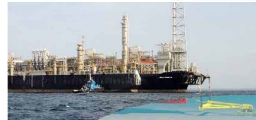
L'usine flottante est stabilisée par un système d'ancrage sous-marin

Mais en quoi consiste un FLNG ? C'est la conceptualisation d'une nouvelle technologie semblable aux navires-usines déjà existants d'exploitation d'hydrocarbures en mer appelés Floating, Production, Storage & Offloading (FPSO).