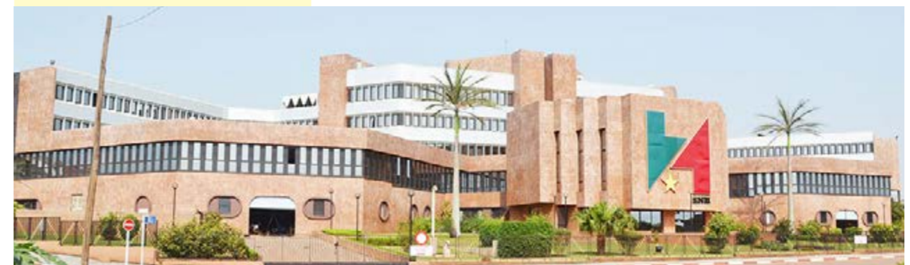
SNH, the leading company in Central Africa