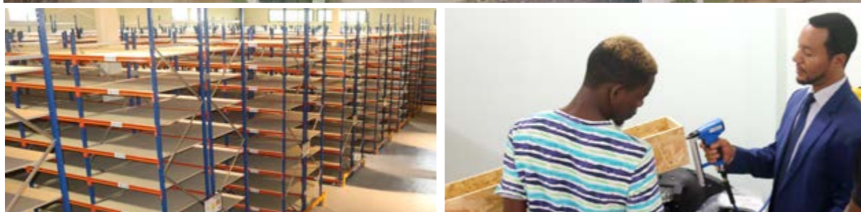
80 000 caisses d'échantillons peuvent être stockées dans la carthèque du CSEF

Le CSEF, nouveau démembrement du Centre d'informations pétrolières (CIP) de la SNH, construit à Mbanga Bakoko (Douala), a pour objet de conserver sur un même site, l'ensemble des collections géologiques issues des forages pétroliers et gaziers réalisés au Cameroun. Il dispose d'équipements à la pointe de la technologie.