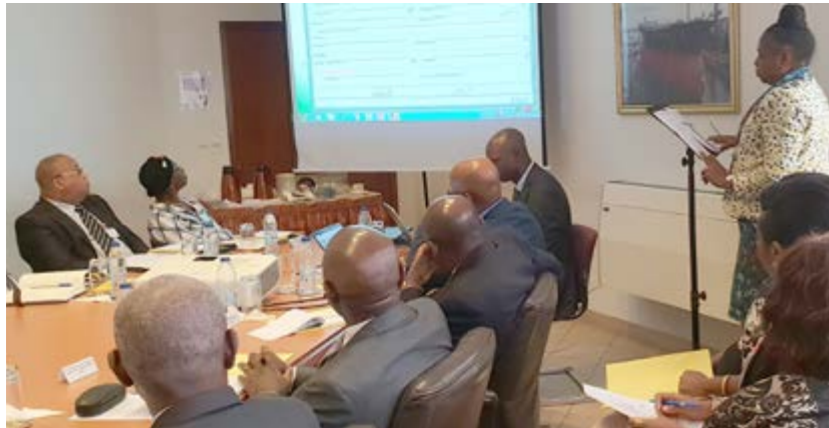
Démonstration des fonctionnalités de Gescourrier

Le nouveau logiciel a été présenté au Directoire le 26 juin, au siège de la SNH.