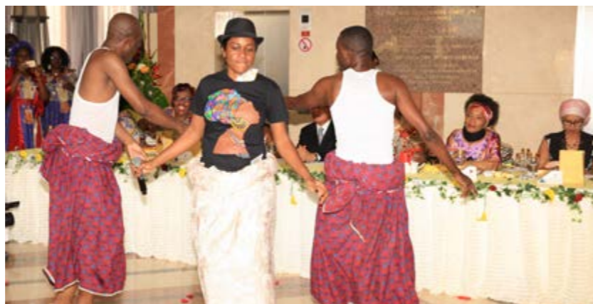
Des prestations artistiques des mamans SNH ont agrémenté le déjeuner