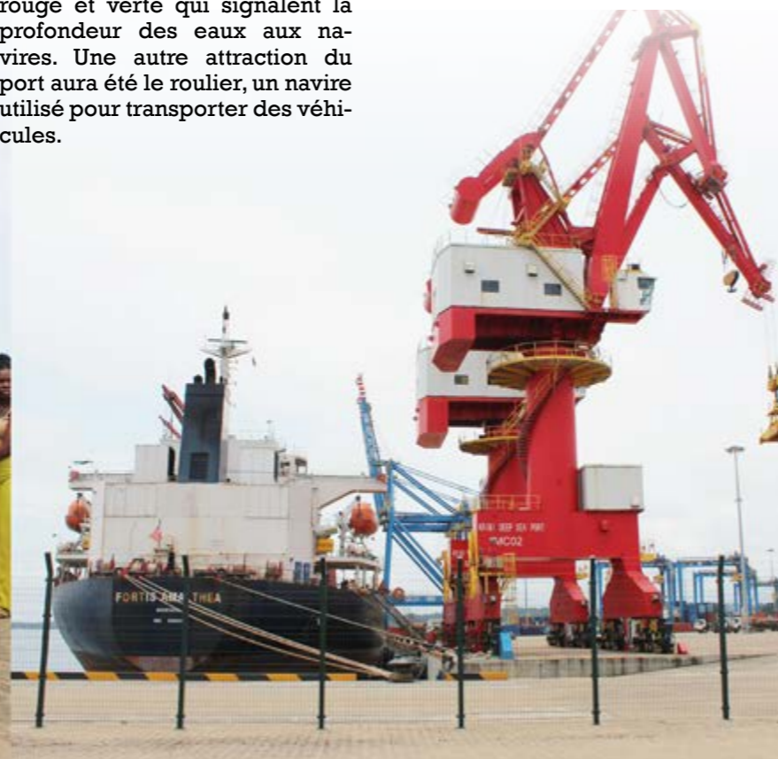
Un agent du port explique son fonctionnement