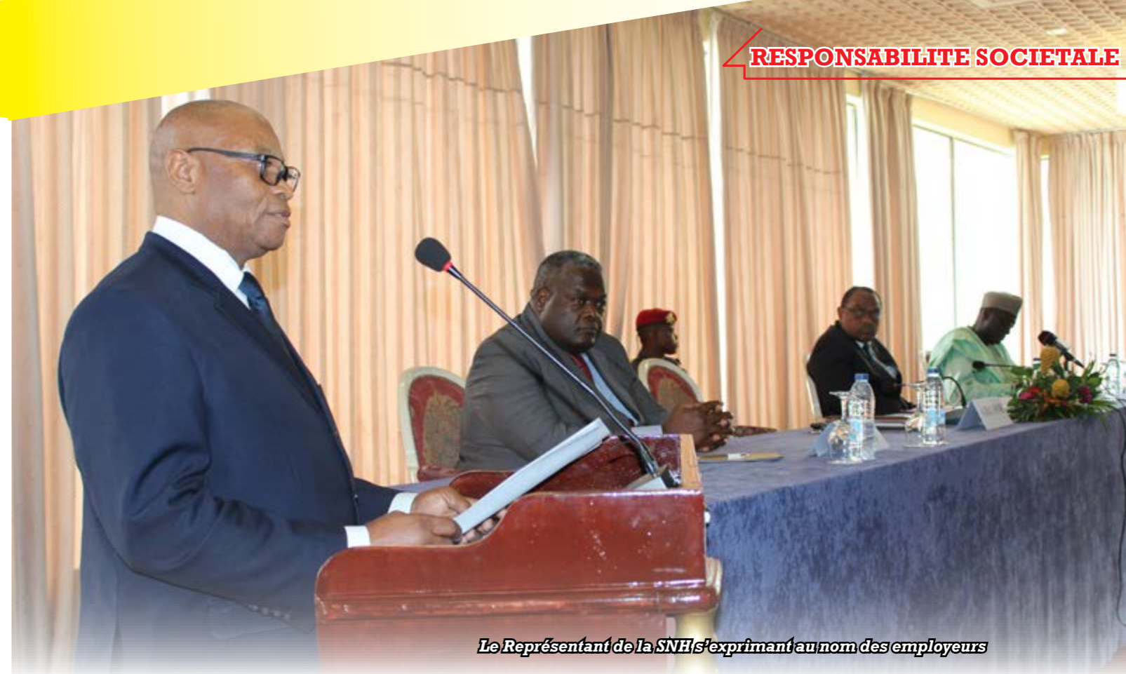
Le Représentant de la SNH s'exprimant au nom des employeurs

Article de Vincent Collen publié dans Les Echos du 11/07/18