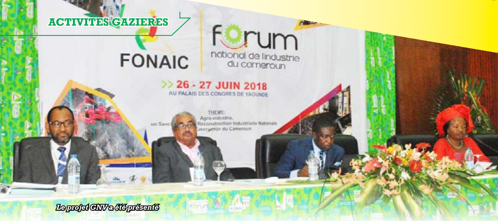
Le projet GNV a été présenté