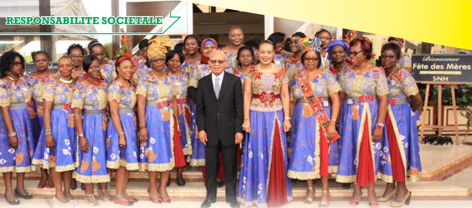
Les mamans de la SNH, tout sourire, autour de l'ADG le 25 mai