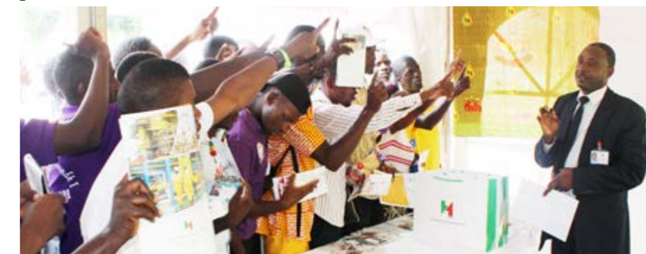
Un quiz gagnant a drainé les foules